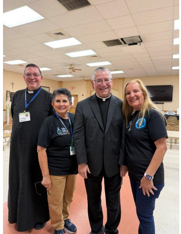
Con nuestro Obispo el Reverendísimo James Tamayo