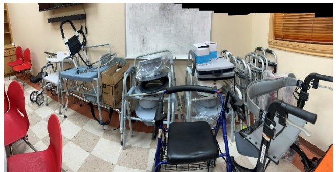
Equipo médico duradero gratuito