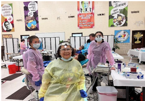
Todo gratis para todos--Este es nuestro equipo dental.