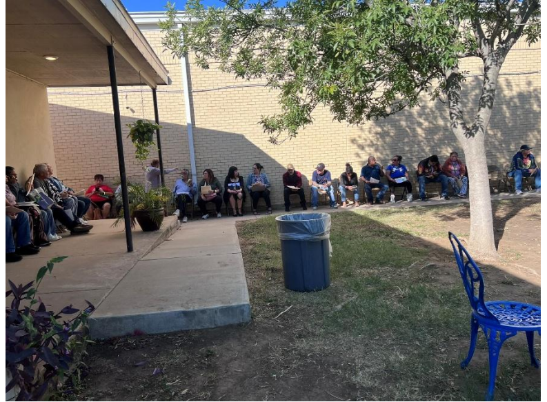
Personas esperando servicios de visión gratuitos y gafas gratis.